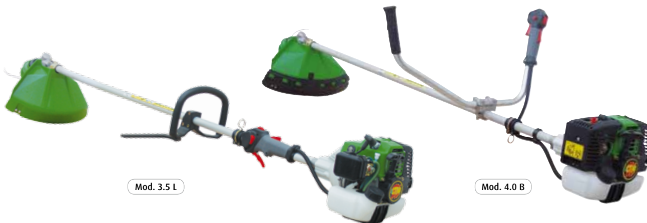
Mod. 3.5 L

asta \varnothing 26 mm - \curvearrowright 1.5 mm